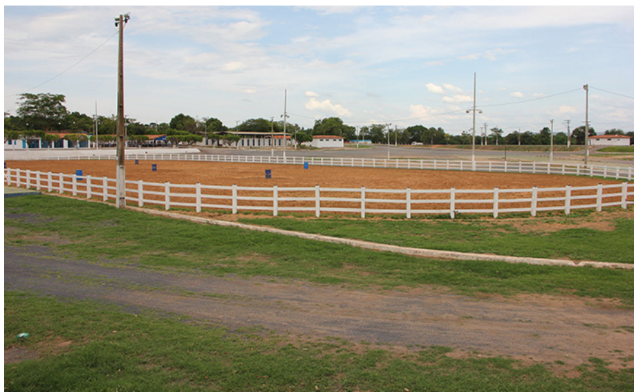
Parque de Exposição Engenheiro Geraldo Rocha