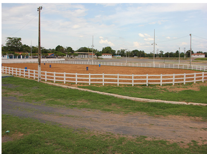
Parque de Exposição Engenheiro Geraldo Rocha

De 15 a 17 de novembro, será realizada no Parque de Exposição Engenheiro Geraldo Rocha, em Barreiras, a Feira de Pró Genética e Oeste Genética, promovida pela Associação Brasileira dos Criadores de Zebu – ABCZ, com o apoio da prefeitura de Barreiras, através da Secretaria de Agricultura, Pecuária e Abastecimento.